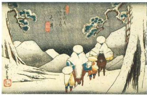
★ 大井宿 (木曾海道六拾九次之内 大井(広重))