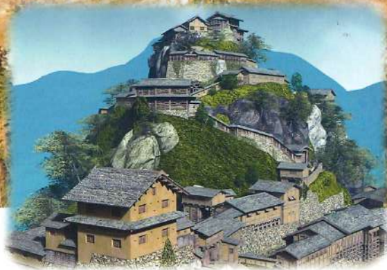
イメージCG：浅野孝司氏制作