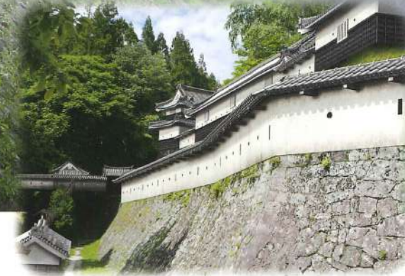
イメージCG：成瀬京司氏制作