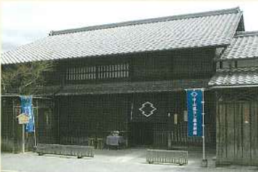
中山道ひし屋資料館

当時41軒の旅籠が立ち並び大いに賑わい誇ったとされる大井宿。ボランティアガイドと一緒に名所や宿場散策を。