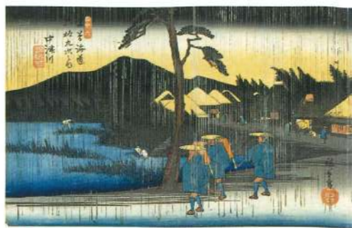
★ 中津川宿(雨の中津川) (木曾海道六拾九次之内 中津川(広重))