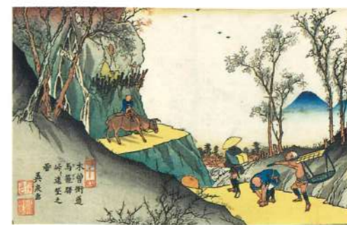
★ 馬籠宿 (木曾街道 馬籠駅 峠ヨリ遠望之図(英泉))