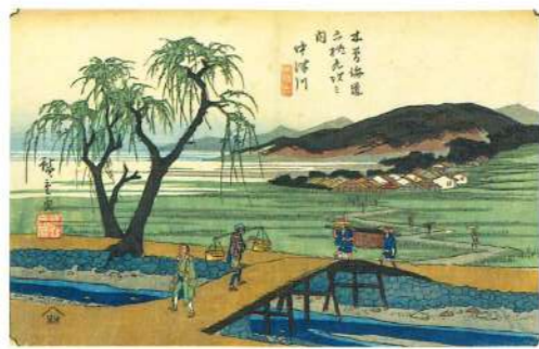
★ 中津川宿(晴れの中津川) (木曾海道六拾九次之内 中津川(広重))