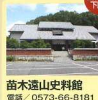
苗木遠山史料館 電話 / 0573-66-8181

史料館で下調べ 有料 苗木城跡ボランティアガイドをご希望の方は、三日前までに史料館へお申込みください。