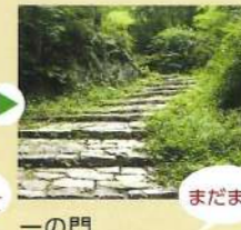
本丸めぐり 一の門