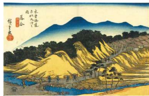
★ 落合宿 (木曾海道六拾九次之内 落合(広重))