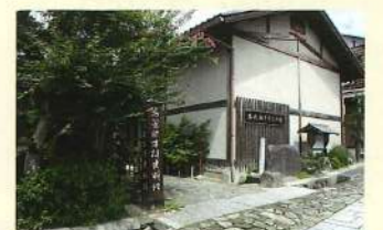
馬籠宿本陣史料館