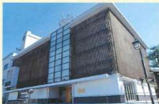
中山道歴史資料館