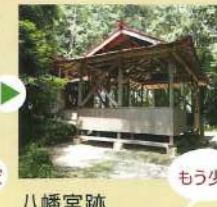
まだまだ 八幡宮跡