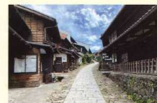
石坂の両脇に並ぶ宿場街