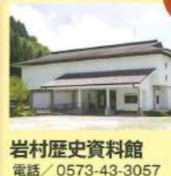
岩村歴史資料館 電話 / 0573-43-3057

資料館で下調べ 有料 岩村町観光ガイドをご希望の方は、10日前までに下記へお問い合わせください。 恵那市観光協会岩村支部 電話 / 0573-43-3231