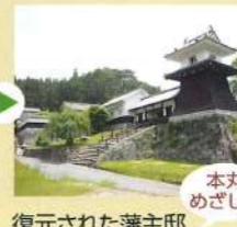
復元された藩主邸

資料館で下調べ 有料 岩村町観光ガイドをご希望の方は、10日前までに下記へお問い合わせください。 恵那市観光協会岩村支部 電話 / 0573-43-3231