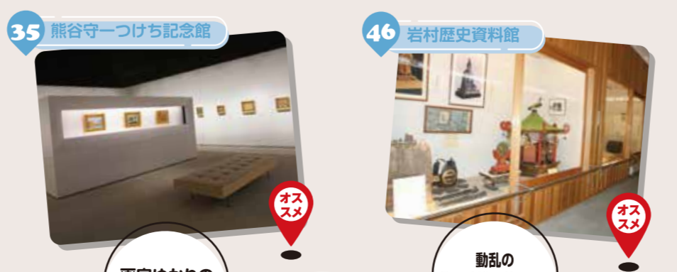
画家ゆかりの品々も展示

歴史的な建造物や中山道にまつわる資料館、体験型の博物館・科学館、ひとりの作家にスポットを当てた美術館など、パリエーションに富んだ施設の数々。心満たされる時間を過ごせます。