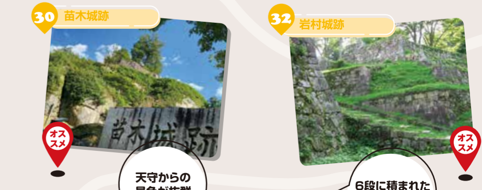
天守からの景色が抜群

自然の地形を活かして築かれた苗木城、日本三大山城のひとつの岩村城をはじめ、他にも多くの戦国時代の面影を遺す城跡が点在していますので、ゆったりご散策ください。